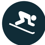
ACTIVITÉS récréatives et développement touristique