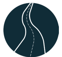
CORRIDORS de transport et de services