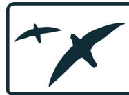
ESPÈCES FAUNIQUES EN SITUATION PRÉCAIRE