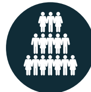
SURFRÉQUENTATION des parcs et des milieux naturels