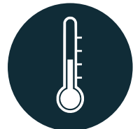
CHANGEMENTS CLIMATIQUES et POLLUTION