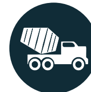
EXPLOITATION NON DURABLE DES RESSOURCES