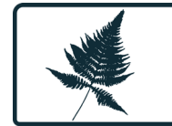
ESPÈCES FLORISTIQUES EN SITUATION PRÉCAIRE