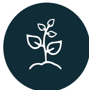
ESPÈCES ENVAHISSANTES exotiques et indigènes